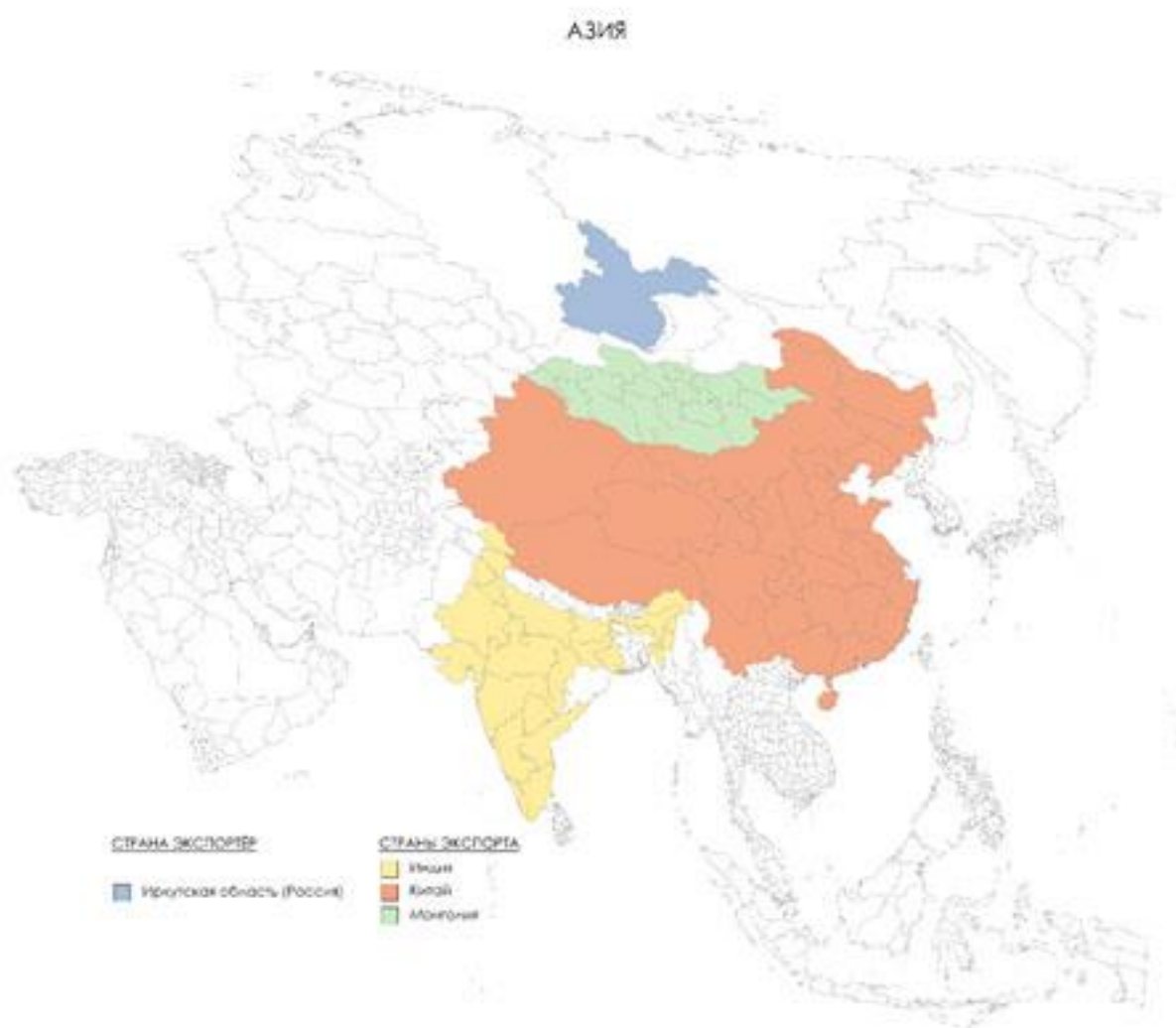
Рис. 2. Страны экспорта

Образование Иркутской области может быть экспортируемо по нескольким причинам. Во-первых, это близкое расположение к главным странам-партнерам, таким как: Монголия, Китай, Индия.