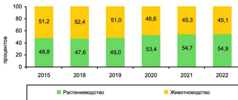
Рис.2. Сравнение сельскохозяйственных компаний в сфере растениеводства и животноводства, %

Таким образом, можем сделать вывод о том, что аграрный сектор нуждается в дальнейшем развитии. Вследствие ухода иностранных поставщиков необходимо сосредоточиться на формировании отечественного рынка по производству семян, созданию удобрений и другим направлениям. Важно также повышать качество и безопасность продукции, что возможно достигнуть путем укрепления сельскохозяйственных предприятий.