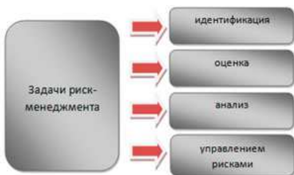
Рис.2. Основные задачи риск-менеджмента

Всегда центральная часть стратегического управления любой организации (будь то коммерческое предприятие или банк) — это риск-менеджмент. Основными задачами риск-менеджмента являются (см.рис.2):