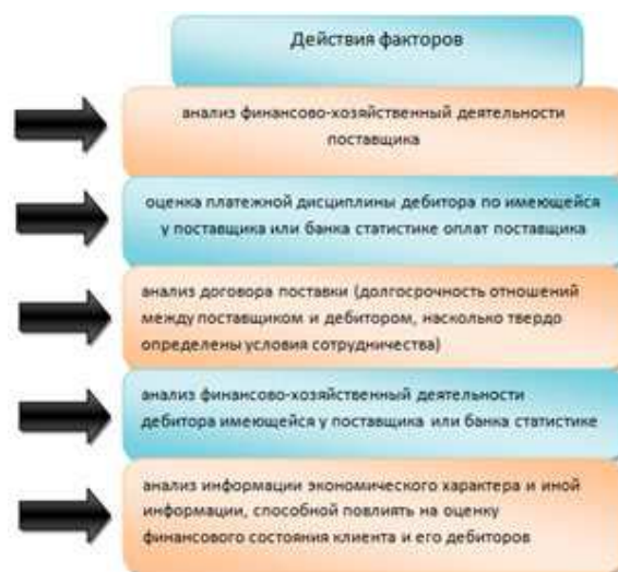
Рис.3. Действия фактора при построении системы риск-менеджмента

Эффективность факторингового бизнеса зависит именно от того насколько качественно выстроена система управления рисками. Что же предпринимают факторы для построения системы риск-менеджмента? Обратите внимание на рисунок 3.