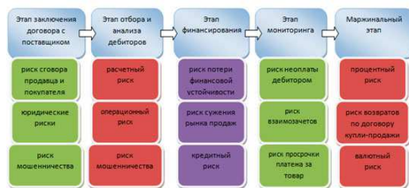
Рис.6. Классификация рисков по этапам жизненного цикла факторинговой операции

Отметим, что уровень принимаемого риска для каждого конкретного фактора (будь то факторинговая компания или факторинговый отдел банка) в значительной степени обусловлен целями ее участников и средствами ее достижения. Результаты классификации рисков по этапам факторинговой сделки также представлены на рисунке 6.