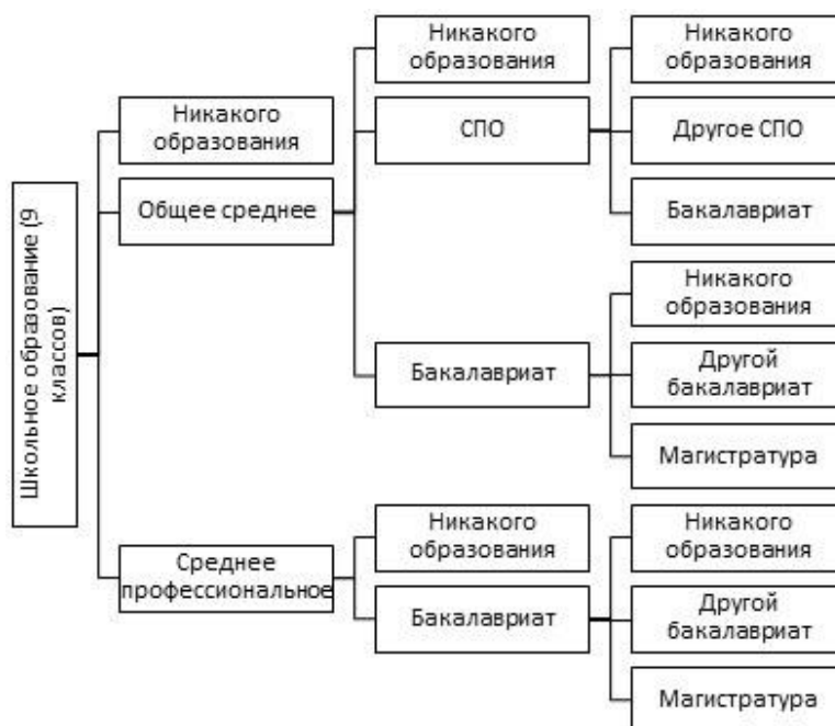
Рис. 1. Образовательная траектория школьника

дальше либо не учиться и идти работать (с последующим призывом на военную службу), либо получить профессиональное образование (среднее или высшее) и начать выстраивать дальнейшую образовательную траекторию (рис 1.).