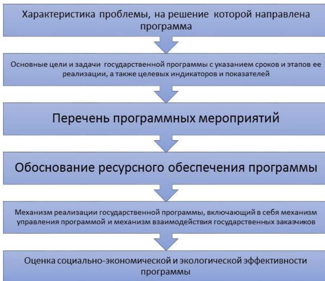
Рис. 1. Структура государственной целевой программы [2]

Структура государственной целевой программы [2]: