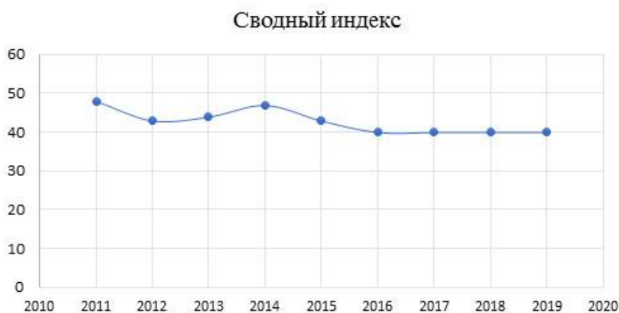
Рис. 1. Динамика сводного индекса по Иркутской области 2011-2019 гг.

Проанализировав динамику состояния Иркутской области (Рис. 1) по сводному индексу (содержит природоохранный, промышленно-экологический и социально-экологический индексы), можно сделать вывод о том, что состояние экологии Иркутской области ухудшается. Промедление в реализации природоохранных мероприятий влияет на то, что Иркутская область находится на 85-й из 85 строчек рейтинга [1].