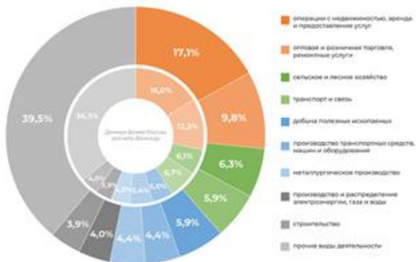
Рис. 1. Динамика кредитования и просроченной задолженности по кредитам

Динамика уровня просроченной кредитной задолженности характеризуется разнонаправленностью. Т.е. рассматривая задолженность по корпоративному кредитованию за 2020 год сложилась следующая тенденция: в первом квартале наблюдалось снижение, во втором произошел стремительный рост задолженности, но во втором полугодии снова произошло снижение уровня задолженности по корпоративному кредитованию. Ситуация по кредитованию физических лиц была следующей: до августа 2020 года наблюдался рост задолженности, после чего произошло снижение, достигнув значения 4,7%. Совокупный рост по задолженности по кредиту равен 16,6%, что свидетельствует об увеличении, в связи с тем, что за 2019 год данный показатель приравнивался к 11,8% [3].