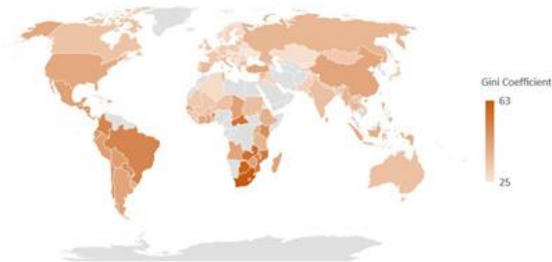
Рис. 2. Коэффициент Джини по странам [7]