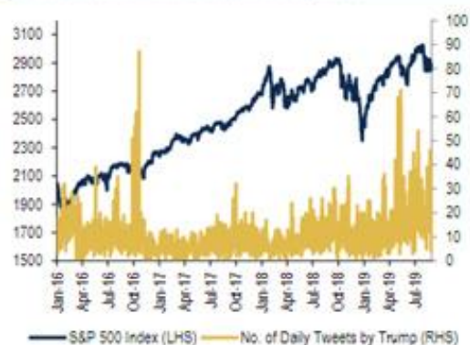
Chart 4: Trade talk and tweets by President Trump have contributed to volatility of late, from China tariffs to Fed policy to tax policy and more S&P 500 Index and number of daily Tweets by Trump