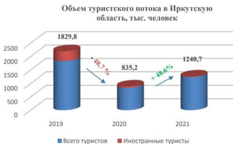
Рис. 1 Объём туристического потока в Иркутскую область

Об актуальности данной статьи говорит то, что, судя по нижеприведённой диаграмме, объёмы туристического потока в Иркутскую область после кризиса 2020-ого года, связанного со вспышкой коронавируса, на момент 2021-ого год не смогли восстановиться даже до уровня 2019-ого, что требует незамедлительного принятия мер. Стоит отметить, что большую часть объёмов обеспечивает именно город Иркутск, а потому его развитие является приоритетной задачей.