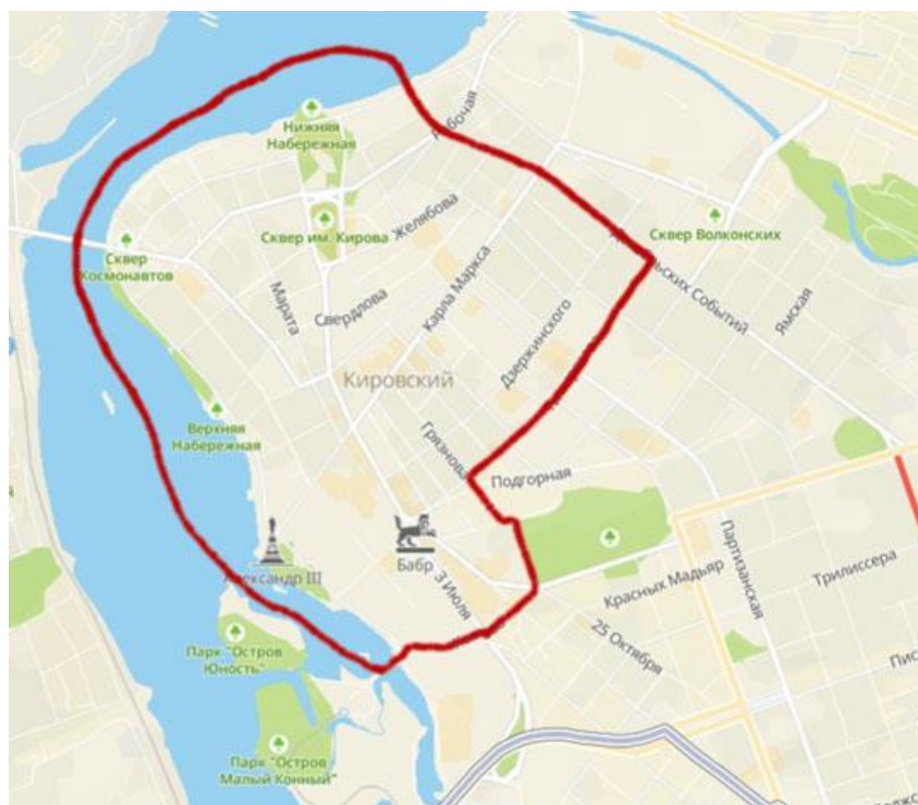
Рис. 2 Границы туристического центра Иркутска

В границах данного туристического центра сосредоточены основные объекты привлечения туристического внимания. Для удобства мы разбили их на несколько групп, инфраструктурного, культурного и развлекательного значения.