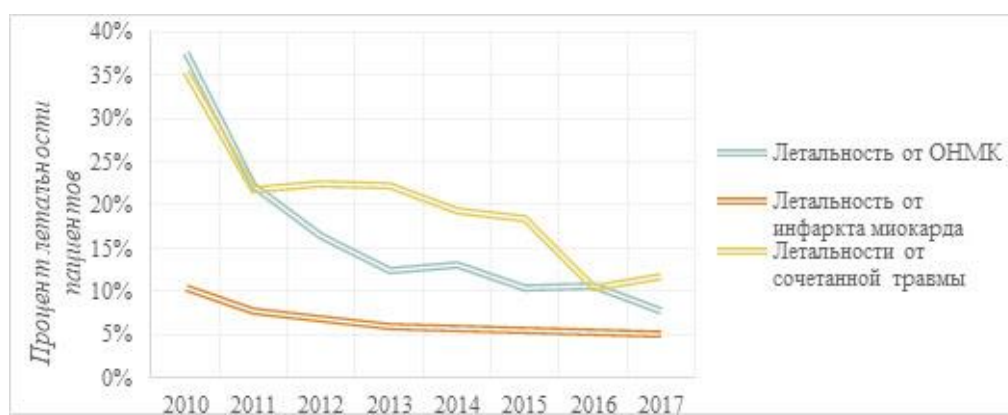
Рис. 3. Результаты внедрения стандартов JCI в ГАУЗ РТ «БСМП» г. Набережные Челны в динамике, 2010–2017 гг. [6]

скорой медицинской помощи» (ГАУЗ РТ «БСМП» г. Набережные Челны) получила аккредитацию в 2015 году, на два года раньше больница получила сертификацию по ISO 9001.