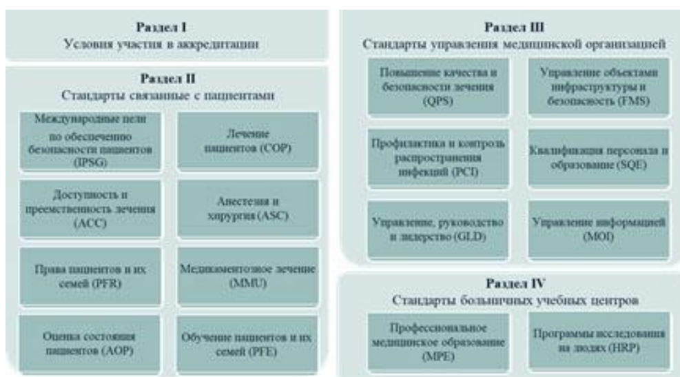
Рис. 1. Структура международного стандарта JCI [1]

Что такое стандарт в понимании JCI? Стандарт — это описание ожидаемого качества и безопасности, при этом у каждого стандарта есть свои показатели, по которым можно будет понять, соответствует ли организация стандарту. Для больниц существует 287 стандартов, включающие в себя 1 146 показателей, которые нужно выполнить. Стандарт JCI состоит из 4 разделов (рис. 1). В первом разделе описаны условия участия в процессе аккредитации и поддержания аккредитационного уровня. Во второй раздел входят стандарты, связанные с пациентами. Третий раздел — стандарты управления медицинской организацией. Четвертый раздел — стандарты больничных учебных центров.