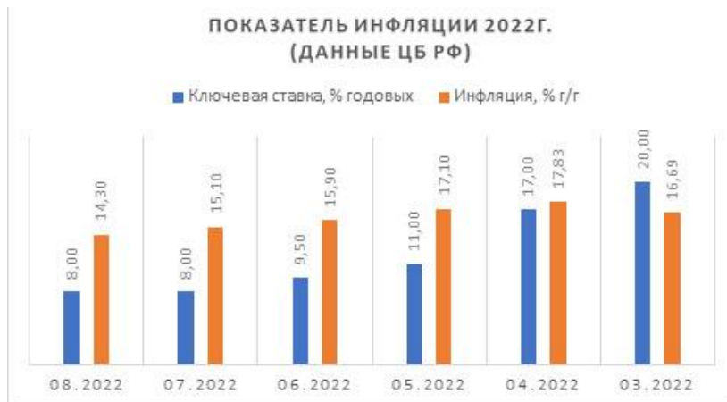
Рис. 2. Уровень инфляции в 2022 г. [3]

Уникальность процесса стагфляции связана с тем, что должна сочетать в себе повышение уровня безработицы, увеличение уровня инфляции и снижение ВВП. В России сейчас происходит структурная перестройка экономики, наблюдается высокая волатильность инфляции. В апреле текущего года ставка инфляции составила 17,6 %, в марте опустилась до значения 16 %. (см. рис. 2)