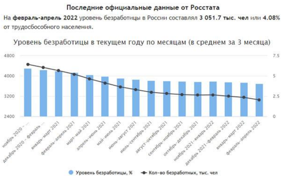
Рис. 3. Уровень безработицы России в период 2020–2022 гг. [5]

Ещё одним ключевым показателем для определения стагфляции является уровень безработицы. По факту на начало 2022 года уровень безработицы достиг своего исторического минимума и составила 3,9 %. Представители Министерства труда и занятости РФ коррелируют безработицу с быстрым реагированием системы и адаптации новых инструментов на рынке. (см. рис. 3)