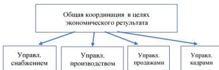
Рис. 2. Декомпозиция процесса управления предприятием

Действительно, управление предприятием складывается из управления отдельными подпроцессами (рис.2): снабжением, производством, продажами, работой с персоналом, работой с финансами, работой с ИТ и т.д.