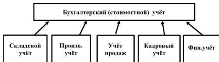
Рис.3. Структура учётной системы

Учётная система на предприятии не линейная. Скорее всего, она имеет иерархическую структуру,