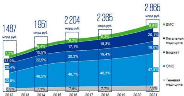
Рис. 1. Структура рынка медицинских услуг в России

государственные больницы (рис.1 Структура рынка медицинских услуг в России) [1].