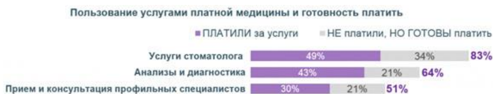
Рис. 3. Спрос на медицинские услуги

На сегодняшний день наблюдается необходимость в расширении спектра медицинских услуг, предоставляемых лабораторией при кожно-венерологическом диспансере, с целью улучшения финансового положения учреждения. Результаты проведенных исследований ясно указывают на высокий спрос на платные медицинские услуги, особенно на анализы и диагностику. Около 43 % опрошенных готовы оплачивать платные услуги, при этом 63 % предпочли воспользоваться возможностью сдачи анализов по полису обязательного медицинского страхования (рис.3 Спрос на медицинские услуги) [5].